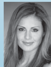
Nazan Eckes, Moderatorin bei RTL